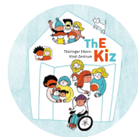
Aufkleber mit Illustration